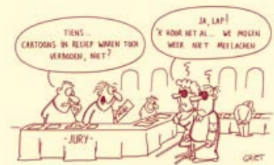
Griet Blockx: "Wedstrijdreglement"

We nemen afstand van de stereotiepe beelden in onze samenleving